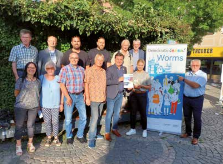
Mitglieder der BVLB-AG mit Bürgermeisterin Lohr auf dem Wormser Obermarkt