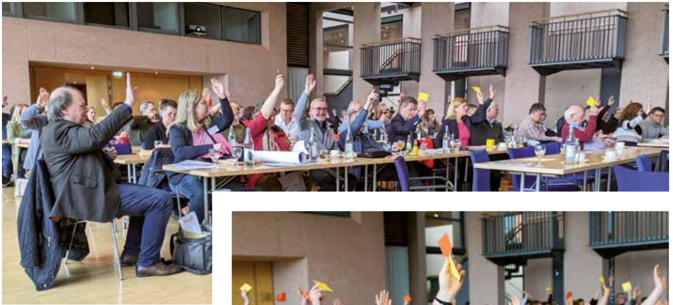
Es galt, insgesamt über 23 Anträge abzustimmen ...