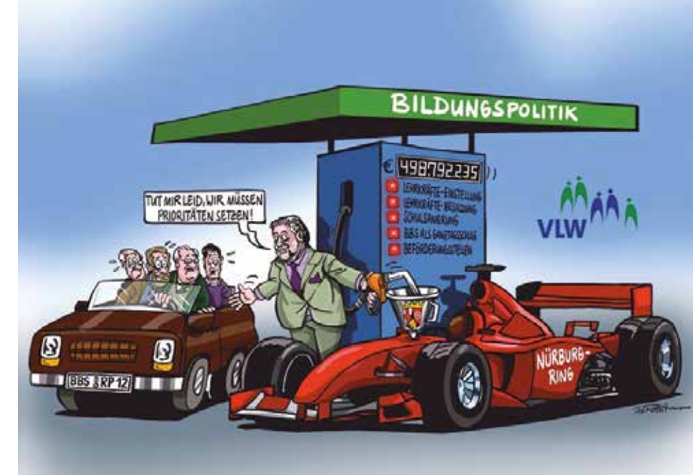
Die erste Karikatur für den VLW Rheinland-Pfalz aus dem Jahre 2012

Woher holen Sie die Ideen für Ihre kreativen Darstellungen?