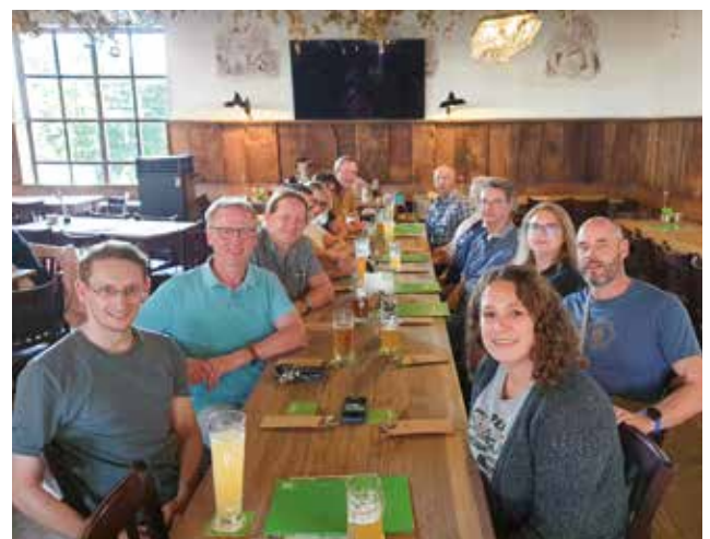
In gemütlicher Runde wurde noch lange über bildungspolitische Themen diskutiert.